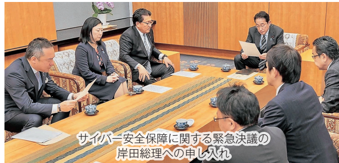
サイバー安全保障に関する緊急決議の 岸田総理への申し入れ