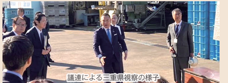
議連による三重県視察の様子