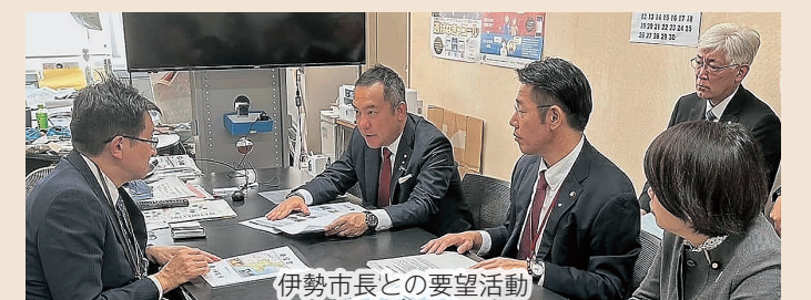
伊勢市長との要望活動

地元からの声を受け、他にも多数の要望を行いましたので、今後ともこれらの要望が実現されるよう全力で取り組んでいきます。