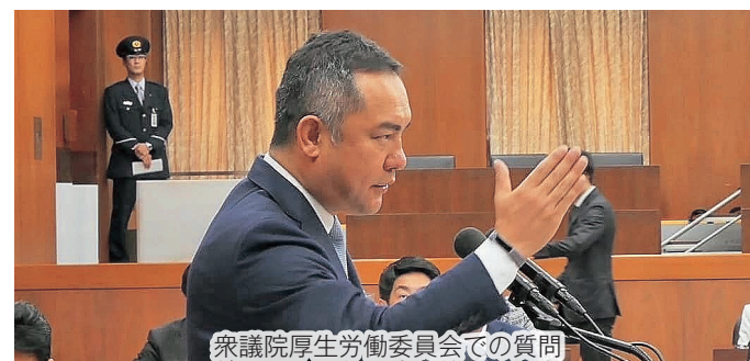
衆議院厚生労働委員会での質問

新薬の薬価算定の改善等の創薬力の強化、医薬品の安定供給の確保等に取り組むとともに、衆議院厚生労働委員会では、薬物乱用防止に向けた学校薬剤師の活用について質問させていただき、厚労省から前向きな答弁をいただきました。今後ともしっかりと取り組んでいきたいと思っています。