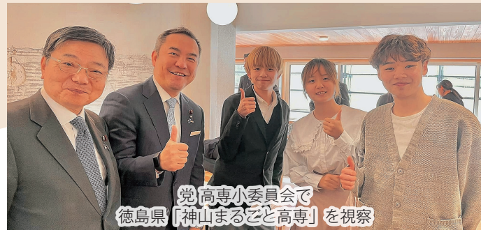
党高専小委員会 徳島県「神山まると高専」を視察