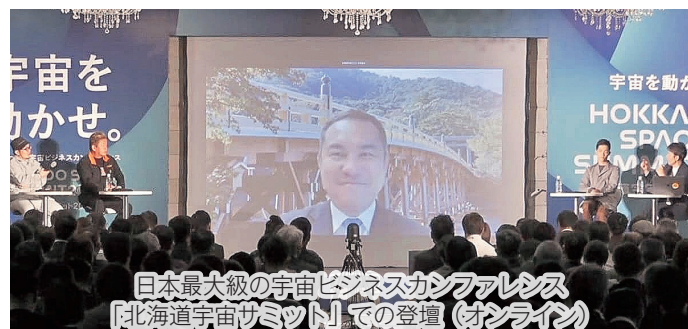
日本最大級の宇宙ビジネスカンファレンス 『北海道宇宙サミット』での登壇（オンライン）

民間企業・大学等による複数年度にわたる宇宙分野の先端技術開発や技術実証、商業化を支援するため、宇宙航空研究開発機構（JAXA）への10年間の「宇宙戦略基金」の設置や、そのために必要な関連法案の成立について、関係府省庁や党と連携して一定の役割を果たすことができました。